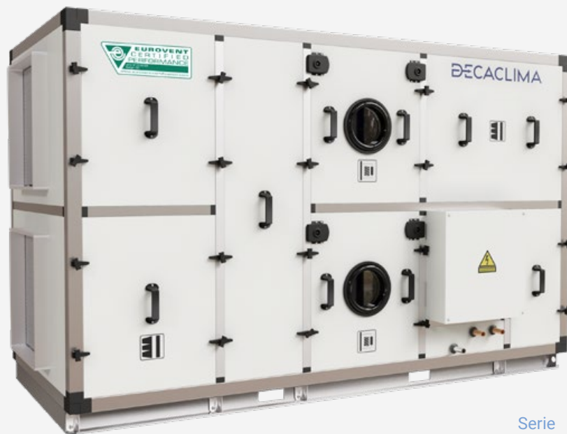
Serie GC RER H